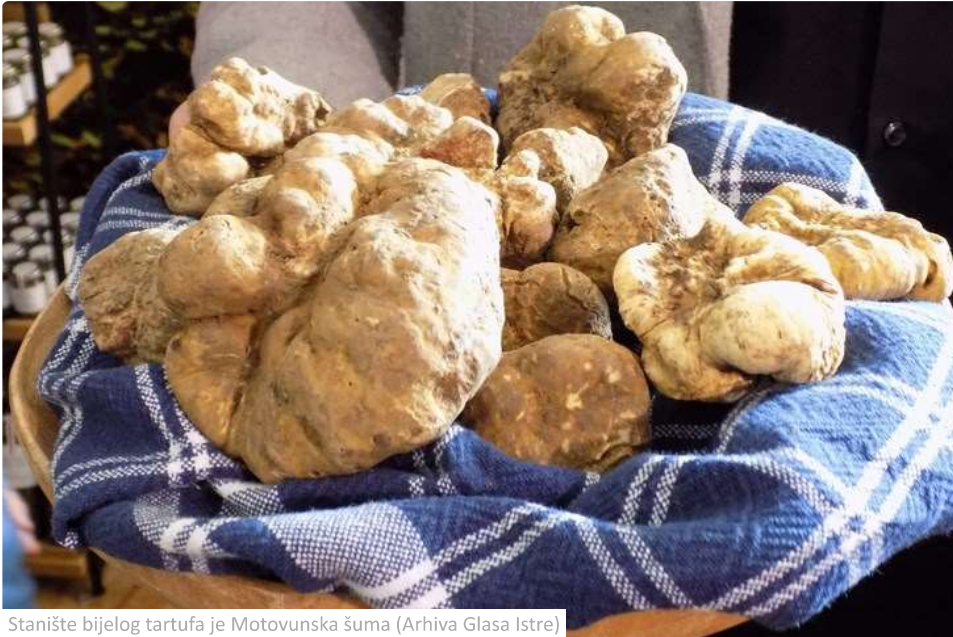
Stanište bijelog tartufa je Motovunska šuma

22.10.2023 06:01 | Autor: Gordana Čalić Šverko